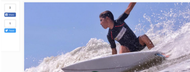
Este domingo a partir de las 8:00 a.m. es la gran final del evento internacional que es respaldado por la Gobernación de Bolívar e Ibercol.

Tres colombianos clasificados para la final del sudamericano de Surfing Infantil