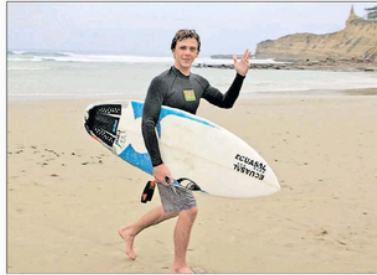
Aspiraciones. El surfista espera terminar la cita en posiciones estelares.

Sáenz nació en Argentina, país de donde es oriunda su progenitora, mientras que su padre es peruano. La pareja de extranjeros se conoció en Montañita. Luego ambos se