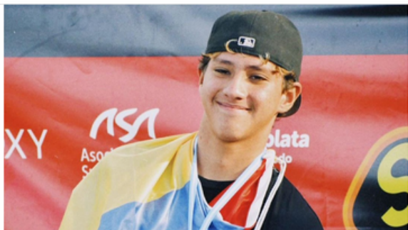
Sobre las olas de Honu Beach, en Mar del Plata, Argentina, el joven surfista colombiano se colgó la medalla de plata de Campeonato Sudamericano Juvenil

Tres colombianos clasificados para la final del sudamericano de Surfing Infantil